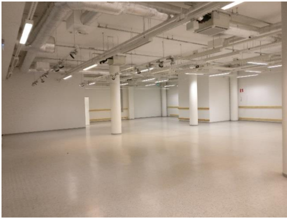
Liiketila 292 m 2