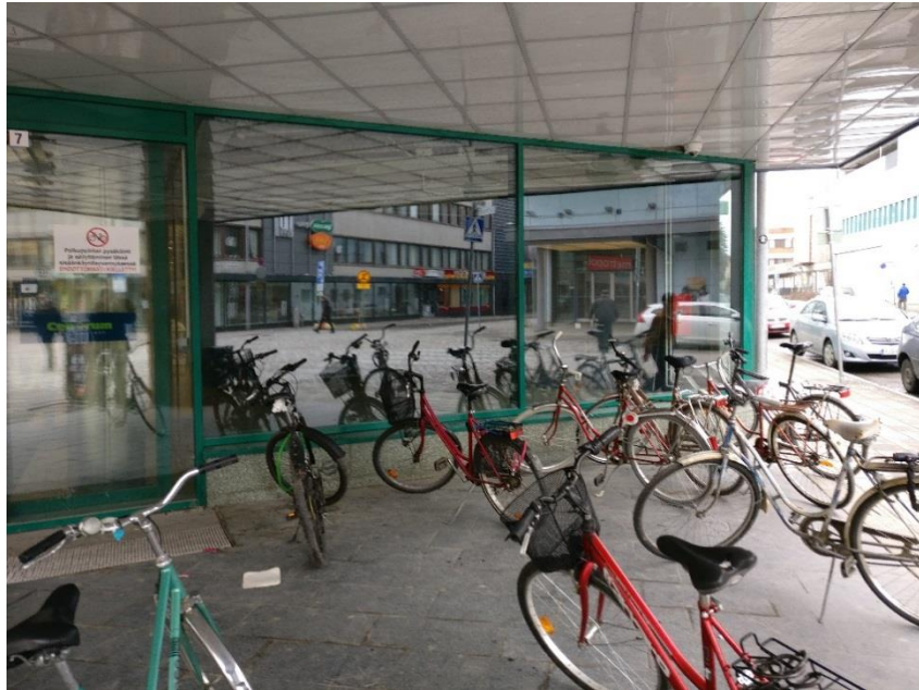
Liiketila 50 m 2 näkymä Kauppa- ja Niskakadun risteykseen.