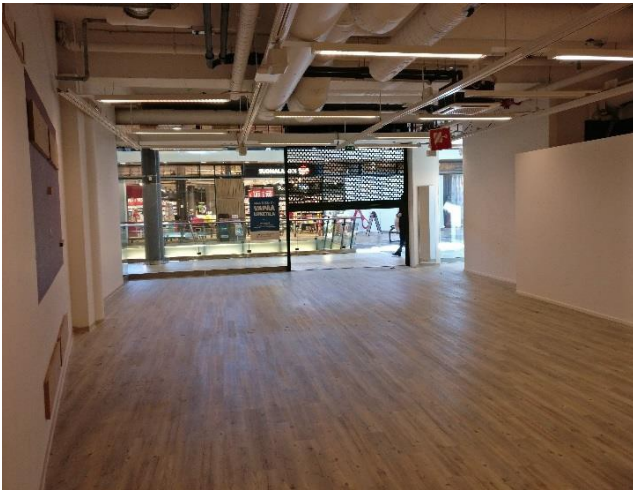
Liiketila takaosasta kuvattuna